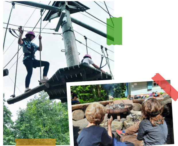
#JuzeMomente Gemeinschaft erleben und unvergessliche Momente erleben