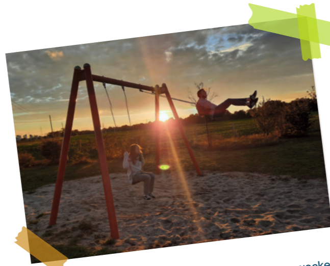
#EigenIdeenZählen Projekte entwickeln & gemeinsam zum Leben erwecken!