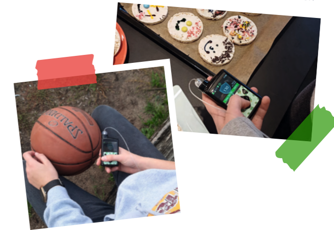
#ZuckerKids Zum Austausch, Stärken und Kennenlernen

Während der Treffen öffnet unser Juze für alle seine Türen, und die Räumlichkeiten können gemeinsam genutzt werden. Die Veranstaltung bietet Eltern eine wertvolle Möglichkeit zum Austausch und zur Vernetzung. Gleichzeitig richtet sie sich an Kinder und Jugendliche mit Diabetes, die in entspannter Atmosphäre Gleichgesinnte kennenlernen können. Ergänzt wird das Angebot durch informative Vorträge und spannende Veranstaltungen.