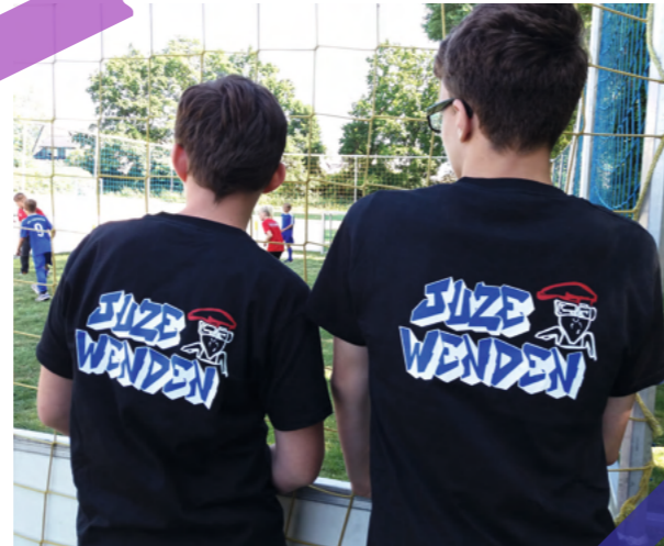
#MitmachenUndGestalten Aktionstage und Freizeit nach eigenen Ideen gestalten!

Das Kinder- und Jugendzentrum Wenden - kurz Juze: Ein Treffpunkt zum Spaß haben, um neue Leute kennenzulernen oder einfach mal vorbeischaun und entdecken, was angeboten wird. Es gibt auch die Möglichkeit, selbst aktiv zu werden und etwas in Bewegung zu bringen.