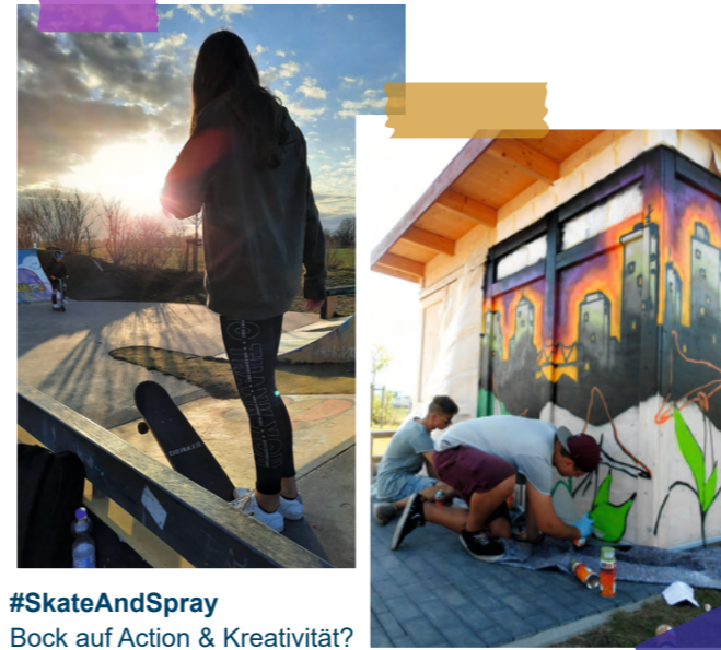
#SkateAndSpray Bock auf Action & Kreativität?

Hier können eigene Gruppen oder Projekte ins Leben gerufen werden – das Juze-Team steht unterstützend zur Seite und hat immer ein offenes Ohr. Gemeinsam lassen sich großartige Ideen verwirklichen!