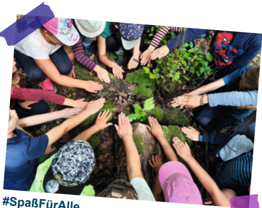
#SpaßFürAlle Für jeden etwas dabei – vorbeikommen & mitmachen